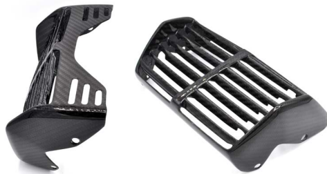
· накладка на масляний радіатор · oil cooler cover