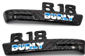
· накладки на бічні кришки (напис може бути будь який) · Inscription, side cover, left & right (the inscription can be anything)