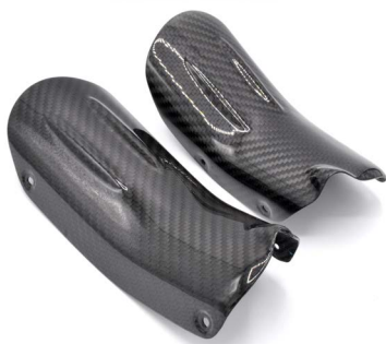
· накладки на впуск 2шт · intake system covers, left & right