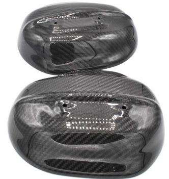
· накладки на головки циліндрів 2шт · cylinder head covers, left & right