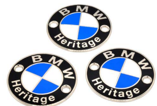
· шильди BMW HERITAGE 3шт · badges BMW HERITAGE 3pcs