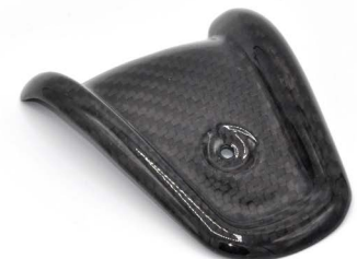
· накладка на паливний бак · fuel tank cover