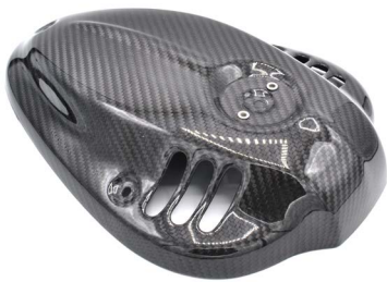
· накладка передня на двигун · front engine cover