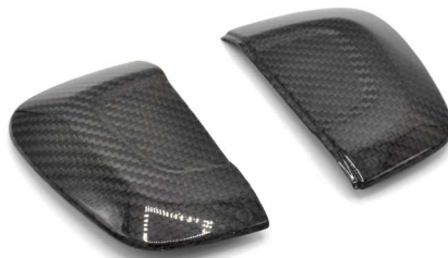
· верхня накладка на двигун · Intake silencer, left & right